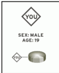
Fig. 1 DISC PERSONALITY